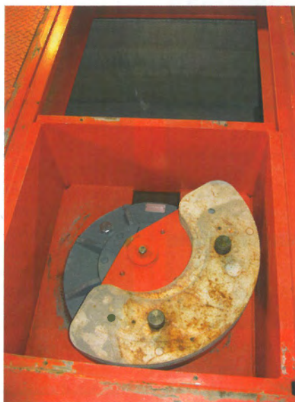
Schwingantrieb mit Unwuchtscheibe